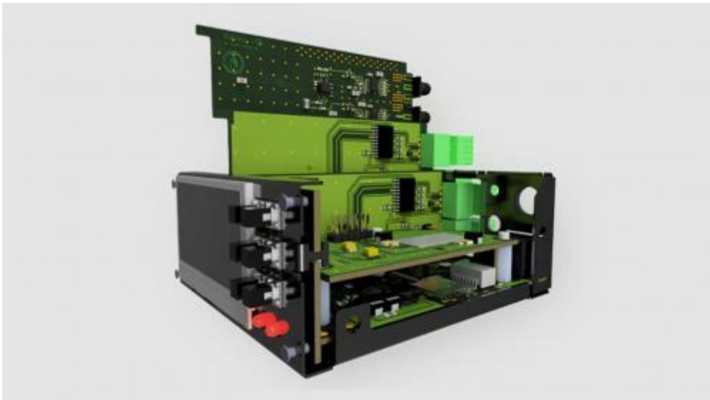
Elektronica met behuizing ontworpen in Fusion 360